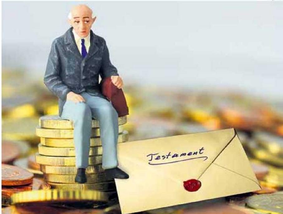
Herr und Frau Österreicher rechnen gemäß einer aktuellen Umfrage mit einem Erbe in Höhe von durchschnittlich 80.000 €

In Wien etwa haben sich einige Profis in jüngster Zeit darauf spezialisiert, gezielt Klienten anzusprechen. Am Ende steht dann oft folgende Lösung: Vererbbarer Immobilienbesitz wird an die Nachkommen verschenkt. Damit ist zunächst einmal die drohende Schenkungssteuer umschiff. Damit der sogenann-